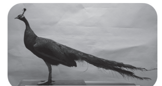
インドクジャク 幼鳥(オス)

毎年、博物館では、鳥類やほ乳類などの剥製や骨格標本を作製し展示しています。今年度は、インドクジャクやメジロなど7点の剥製と骨格標本を作製しました。