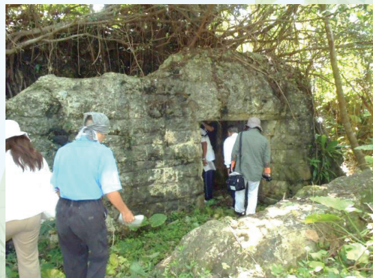
▲H 24 年度に行われた戦跡巡りの様子