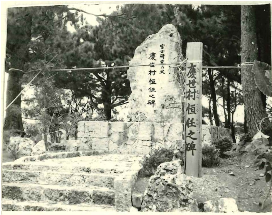
〈資料5〉慶世村恒任之碑 (一九八〇年)